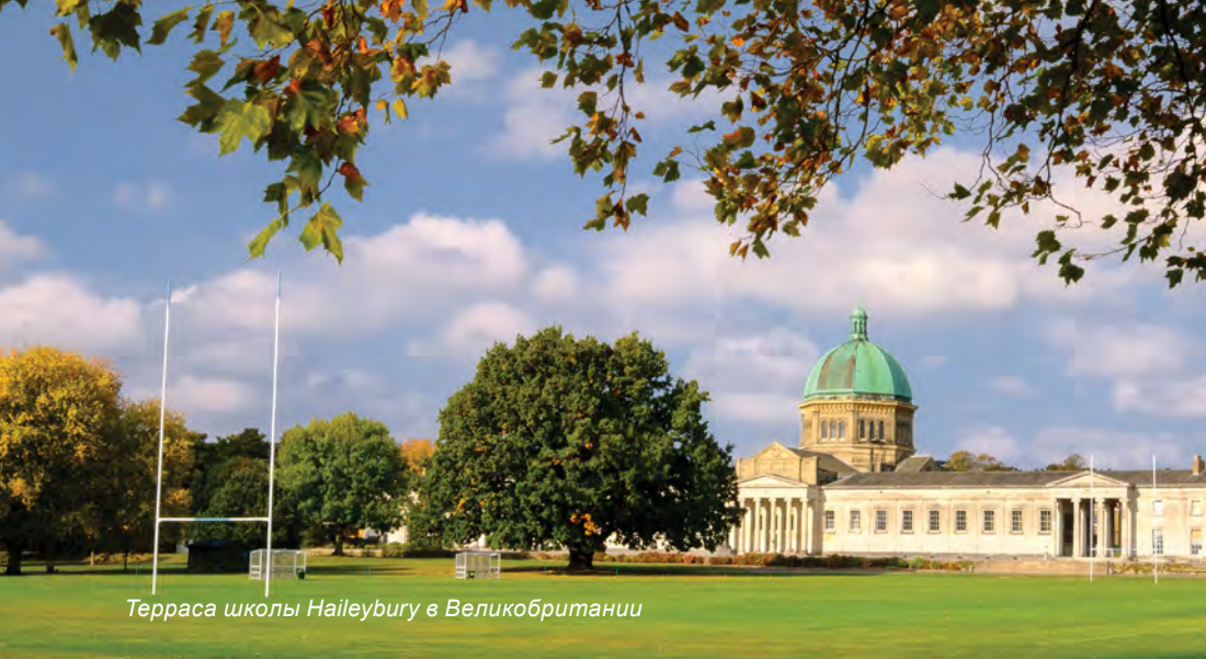
Терраса школы Haileybury в Великобритании

Haileybury UK – ведущая британская частная школа, предлагающая современные пансионы и дневное обучение для учеников из Великобритании и других стран мира. Основанная в 1862 году, Haileybury сочетает в себе традиции и современность, используя более чем 150-летний преподавательский опыт, адаптированный к современным реалиям. Каждый ученик Haileybury Almaty является частью глобальной семьи Haileybury.